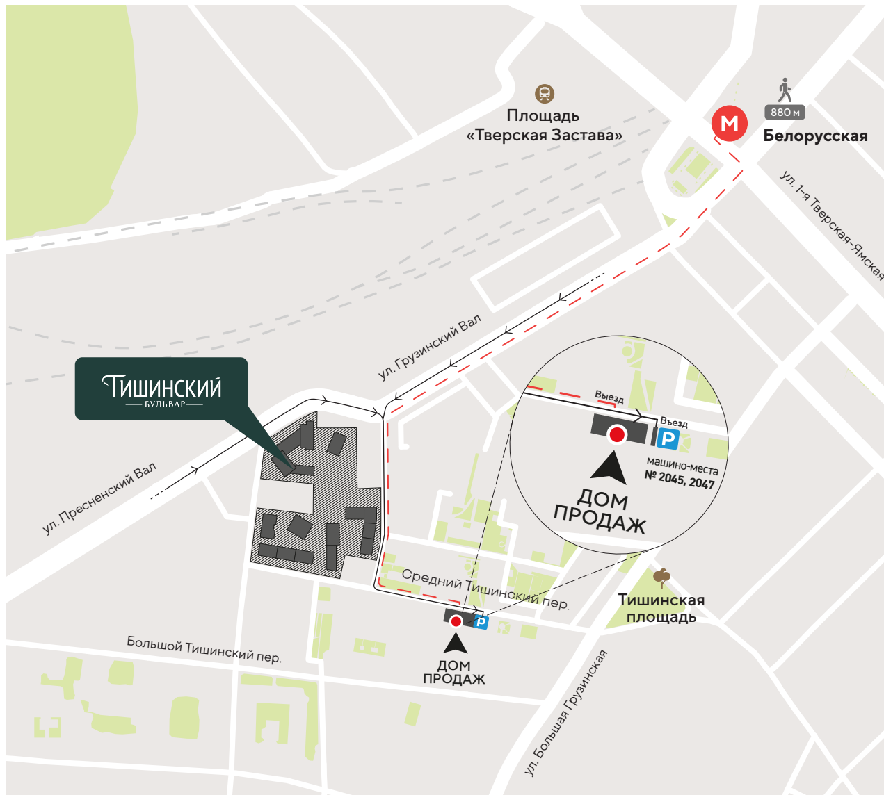
СХЕМА ПРОЕЗДА В ДОМ ПРОДАЖ «ТИШИНСКИЙ БУЛЬВАР»